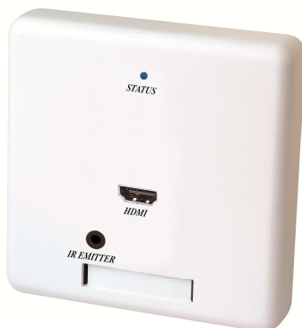
Рис. 1 HW02T.