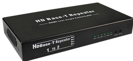
Рис. 1 E-Hi/VTcascad вид спереди