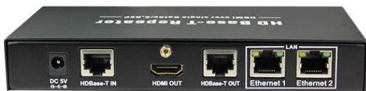
Рис. 2 E-Hi/VTcascad вид сзади