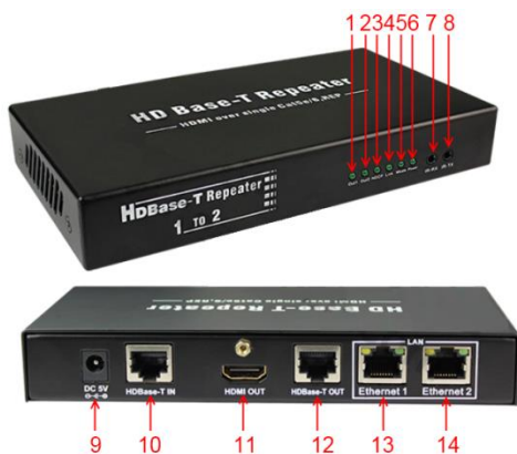
Рис. 3 Элементы E-Hi/VTcascad