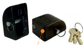
Навесной замок с ключами