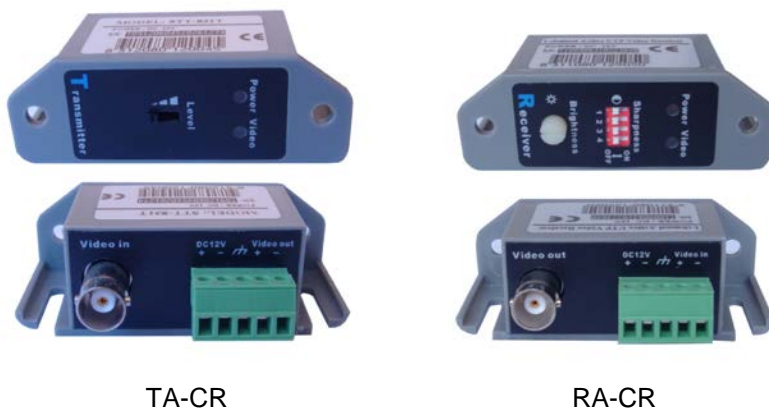
Рис.1 Внешний вид