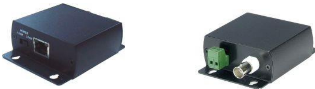
Рис.1 Внешний вид